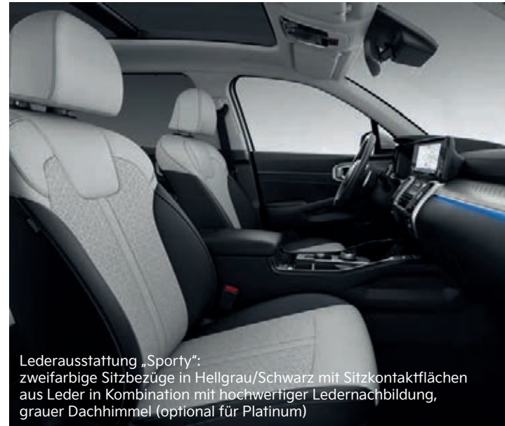
Lederausstattung „Sporty“: zweifarbige Sitzbezüge in Hellgrau/Schwarz mit Sitzkontaktflächen aus Leder in Kombination mit hochwertiger Ledernachbildung, grauer Dachhimmel (optional für Platinum)