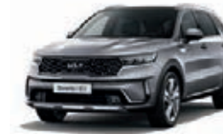
Stahlgrau Metallic (KLG)