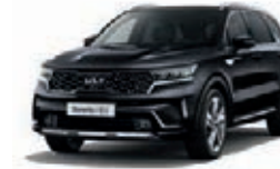
Auroraschwarz Metallic (ABP)

Bei einigen unserer modernen Metallicfarben werden bewusst unterschiedliche Farbpigmente verwendet. Dadurch können unter bestimmten Lichtverhältnissen, z. B. direktes Sonnenlicht, attraktive Farbeffekte erzielt werden. Zum Teil kann die Farbe changieren, z. B. von Schwarz zu Dunkelblau. Bei den hier abgebildeten Farbdarstellungen kann es aufgrund der Drucktechnik zu Abweichungen zu den Originalfarben kommen. Weitere Informationen zu den Farbeffekten und Grundfarben erhältst du bei deinem Kia-Partner. Metalliclackierungen sind aufpreispflichtig.