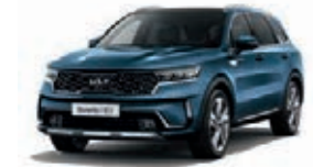
Mineralblau Metallic (M4B)