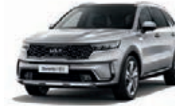
Seidensilber Metallic (4SS)