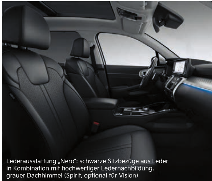
Lederausstattung „Nero“: schwarze Sitzbezüge aus Leder in Kombination mit hochwertiger Ledernachbildung, grauer Dachhimmel (Spirit, optional für Vision)