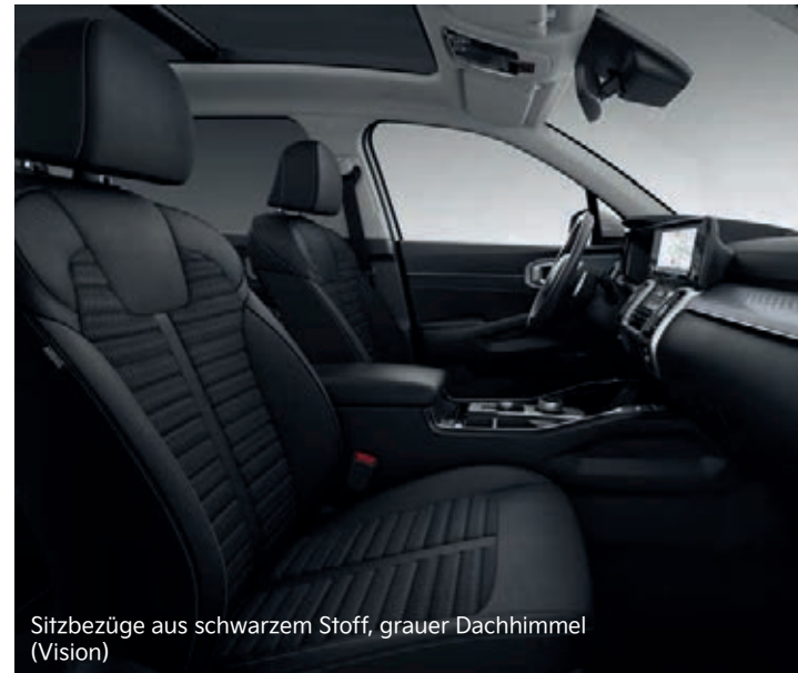
Sitzbezüge aus schwarzem Stoff, grauer Dachhimmel (Vision)

Abbildungen zeigen kostenpflichtige Sonderausstattung. Darstellung: Repräsentation für Sitzkonfiguration.