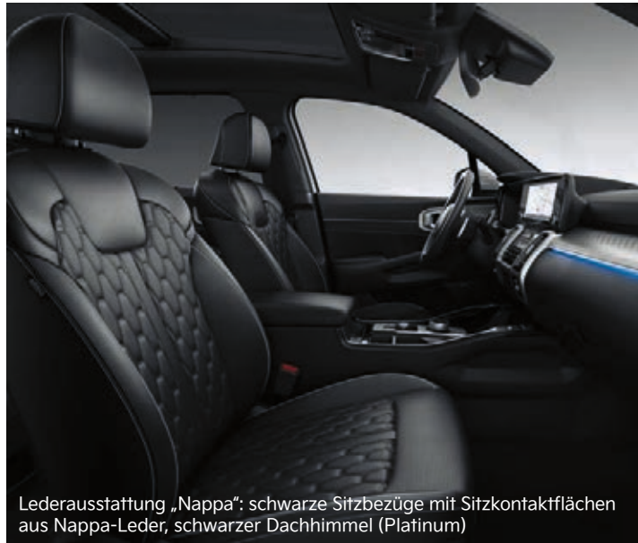
Lederausstattung „Nappa“: schwarze Sitzbezüge mit Sitzkontaktflächen aus Nappa-Leder, schwarzer Dachhimmel (Platinum)

Das elegante und stilvolle Interieur des Kia Sorento wird dich überzeugen. Das Ausstattungsspektrum beinhaltet neben hochwertigen schwarzen Stoffsitzen drei verschiedene Ledervarianten: in Schwarz, zweifarbig in Schwarz-Hellgrau sowie in Schwarz mit Sitzkontaktflächen in Nappa-Leder.