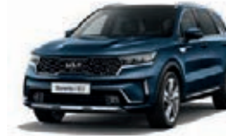
Gravity Blau Metallic (B4U)